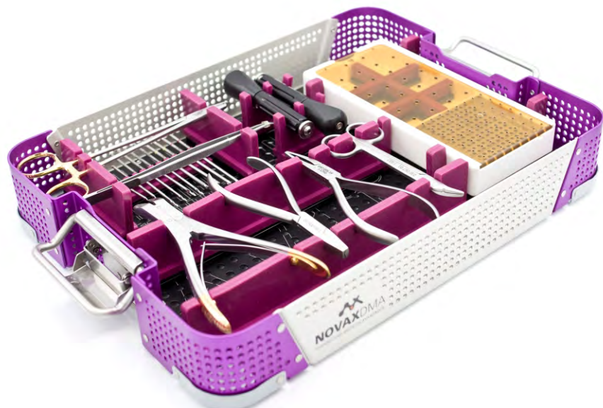
570 001 00 Contenedor Externo metálico chico 570 400 02 Tapa Contenedor Externo metálico chico