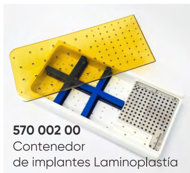
570 002 00 Contenedor de implantes Laminoplastía